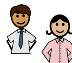
Tu empleador o entrenador