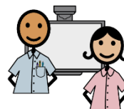
Tu Maestro o Maestra