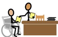
Tu Consejero de Rehabilitación Vocacional